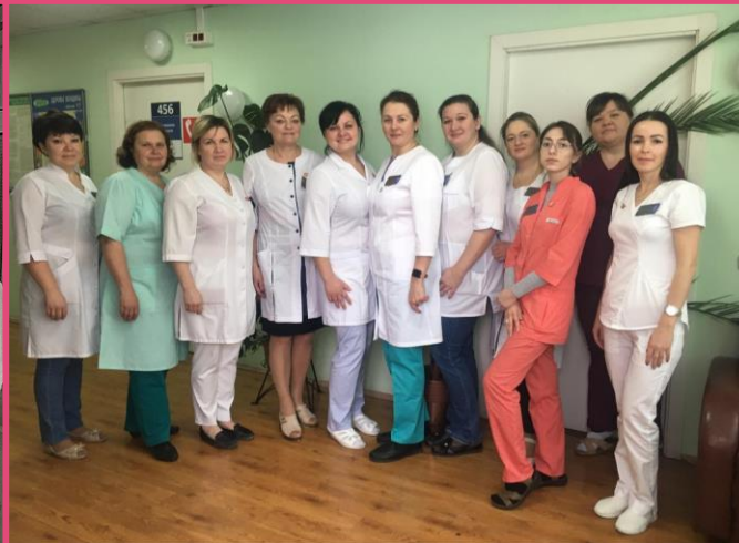
Женская консультация №2 ул. Рудневка, д.8