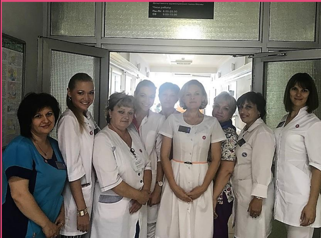
Женская консультация №1 ул. Салтыковская, д.11Б