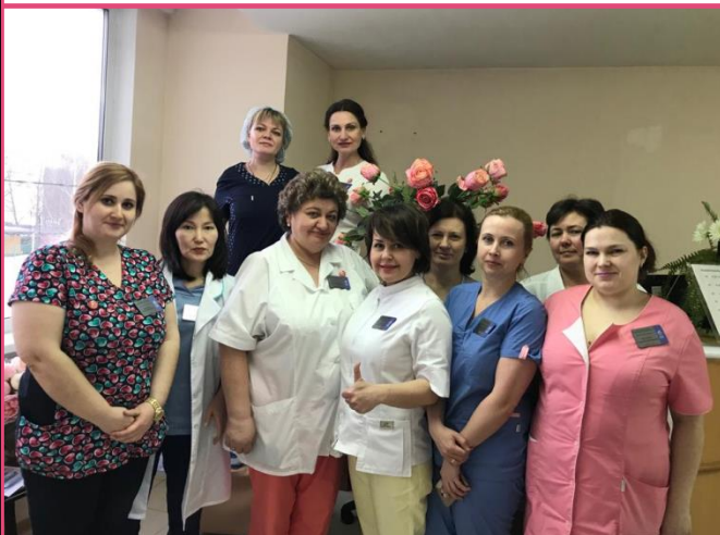
Женская консультация №3 ул. Новокосинская, д.42