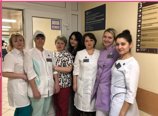
Женская консультация №4 ул. Старый Гай, д.5